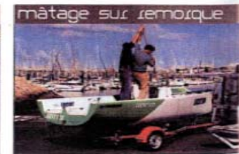
A la différence du Lucky, une seule personne suffit pour mâter en quelques minutes l'Open grâce à son mâtille qui repose sur une petite rotule. Aucune contrainte du côté du transport sur route pour les deux bateaux.