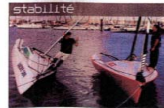
A gauche, Yannick, 71 Illas à bord du Lucky. A droite, Loïc, 73 Illas sur l'Open 5.00. Les deux bateaux sont en configuration quille basse. La différence de stabilité entre l'Open et le Lucky est flagrante.