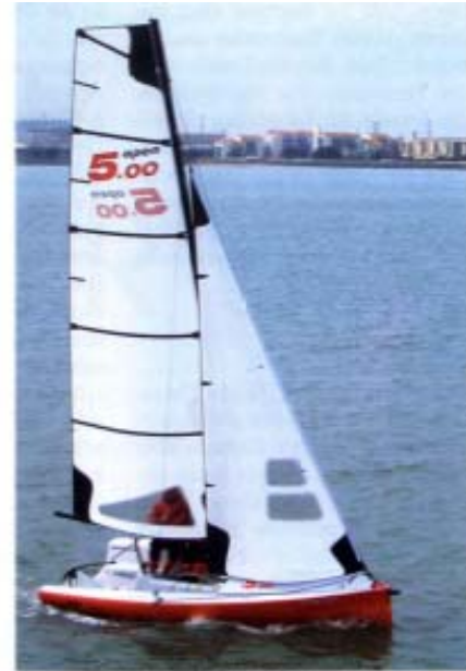
PHILÉAS / GAGE DETECTION / MIRALES/PHI 2008

gefahren – wie auf den grösseren Open-Modellen auch. Damit kann die Fock auch bei viel Wind bequem, leicht und im Luv sitzend effizient eingestellt werden.