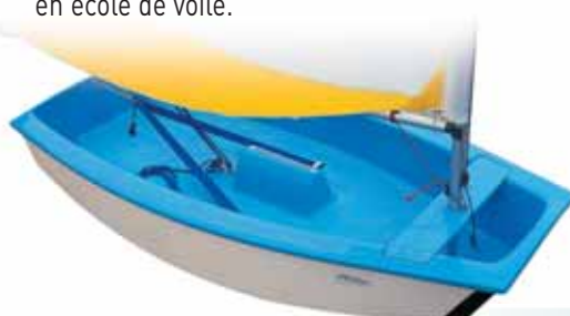
Cockpit ergonomique autovideur Protection des angles caoutchouc

Poids de la coque : 39 kg Longueur : 2,33 m Largeur : 1,13 m Surface voile : 3,60 m 2